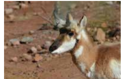
https://de.freepik.com/fotos-kostenlos/direkter-blick-in-das-gesicht-einer-gabelbockantilope-auf-den-trockenen-ebenen_23106407.htm#query=gabelbock&position=0&from_view=keyword&track=sph Bild von DejaVu Designs auf Freepik

Auf Langstrecken ist der Gabelbock das schnellste an Land lebende Tier nach dem Geparden. Er schafft eine Geschwindigkeit von bis zu 88km/h auf einer Strecke von bis zu 5 km. Er gehört zu den Antilopen und lebt in Nordamerika.