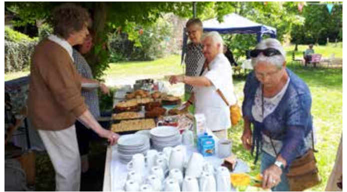
Die Gäste des offenen Atelier hatten einen entspannten Kunstnachmittag im Haus Lachmund und beim Genuß des Kuchenbüffets.