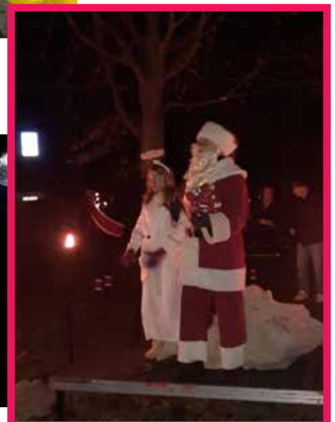
2024-12-24 - WEIHNACHTSABEND