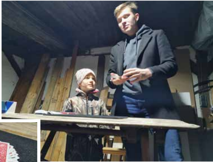
2024-12-09 - Kartentricks-Zaubershow