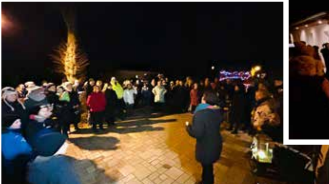
2024-12-01 - Eröffnung Adventskalender