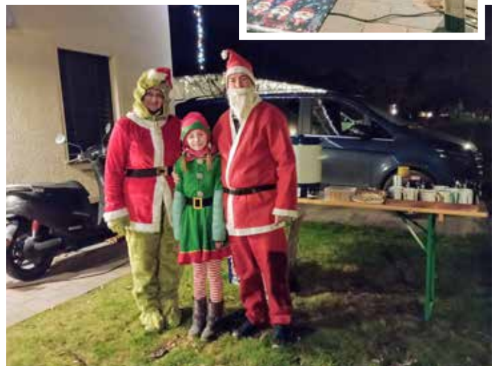
2024-12-11 - Weihnachts-Grinch