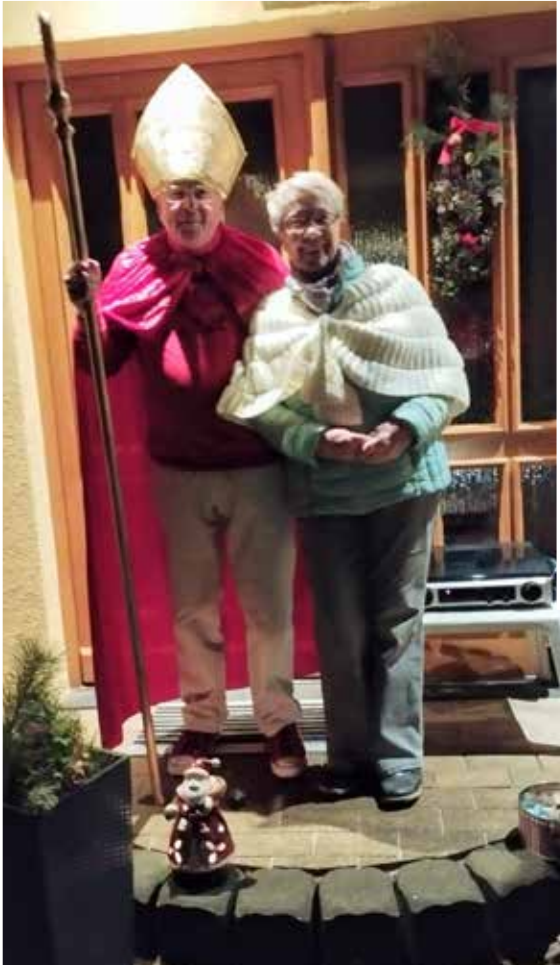
2024-12-06 - Nikolaus