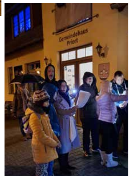
2024-12-07 - Weihnachtssingen im Regen