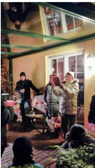
2024-12-19 - Märchenerzählung