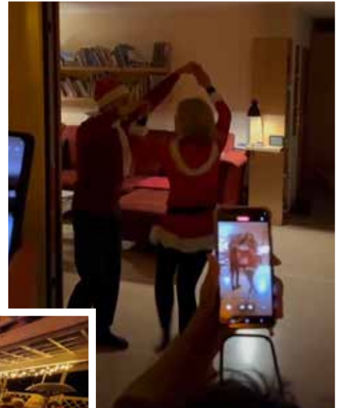
2024-12-14 - Salsa Tanzvorführung