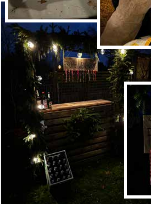
2024-12-23 - WEINachtszeit