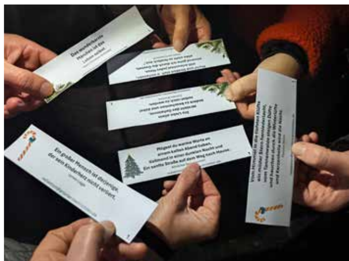
2024-12-18 - Sprüchezetzel Redeabend