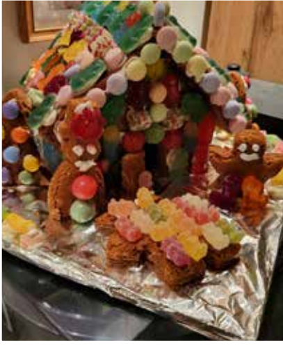
2024-12-21 - Lebkuchenhaus