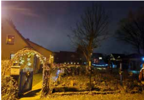
2024-12-13 - EinzigArt Keramik