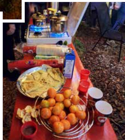
2024-12-08 - Weihnachtsleckereien