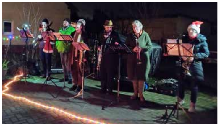
2024-12-17 - Posaunenkonzert