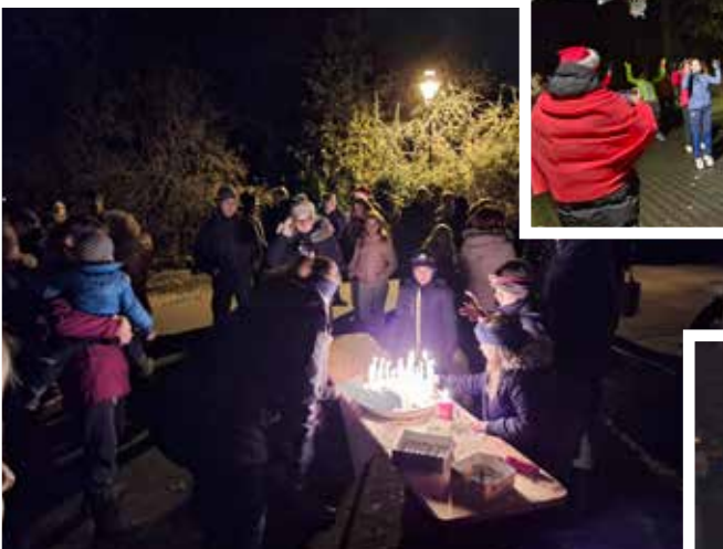
2024-12-04 - Friedenslichtkerze anzünden