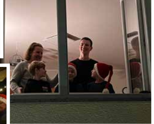
2024-12-20 - Weihnachtskonzert