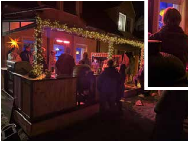
2024-12-10 - Weihnachtsgeschichte