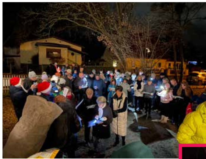
2024-12-22 - Papiersterne basteln