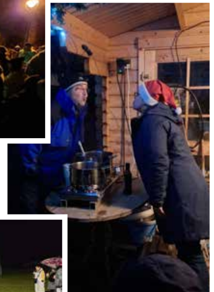
2024-12-02 - Weihnachtsgetränke