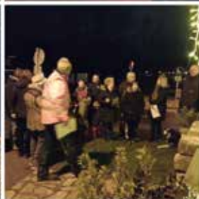
2024-12-16 - Weihnachtslieder Backstübchen