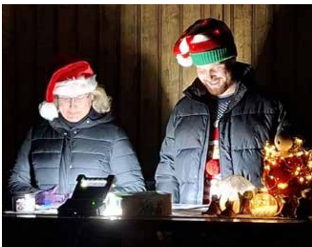
2024-12-12 - Verlorener Keks