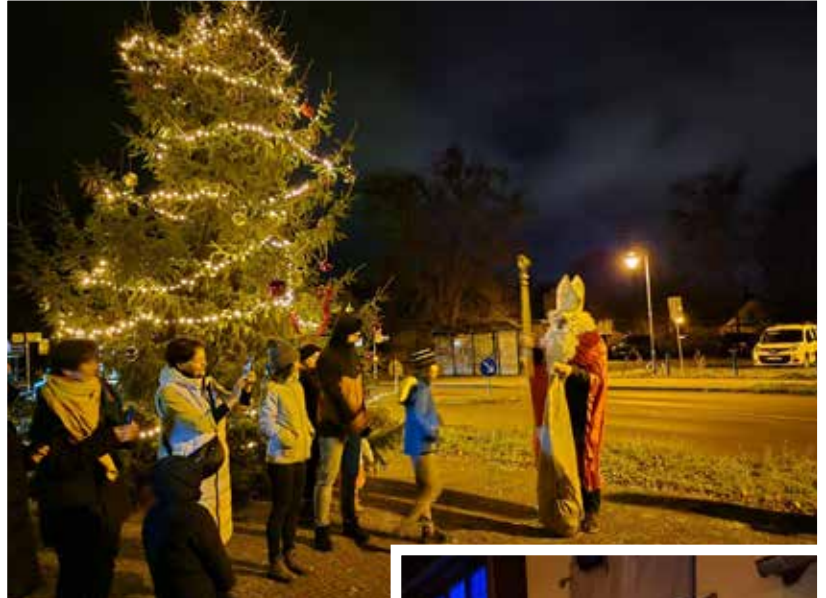
2024-12-05 - Fotos mit Nikolaus